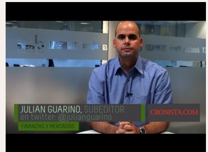
El blue seguirá cayendo en los próximos días

Ingresar ¿Olvidó su contraseña? Recordarme en este equipo