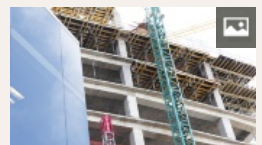
Las 30 claves para invertir en ladrillos