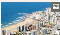
La crisis argentina vuelve a poner en jaque la temporada de verano de Punta del Este