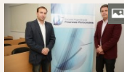
Finanzas personales: opciones de inversión para distintos escenarios y expectativas