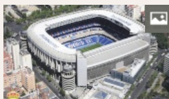
El Real Madrid negocia el nuevo nombre de su estadio por más de u$s 500 millones