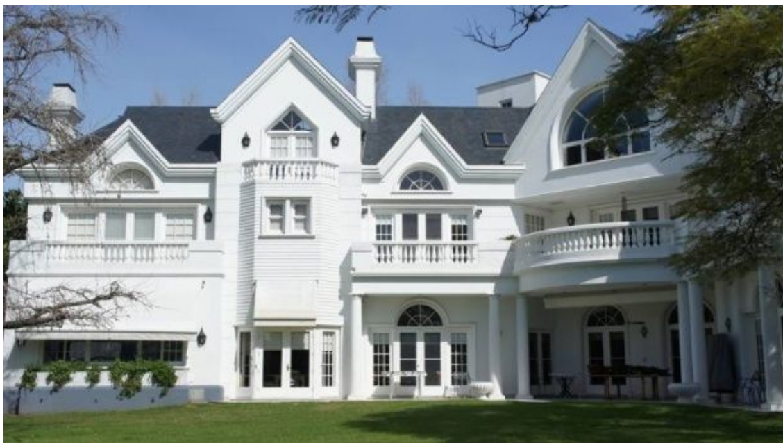
La mira de los "blanqueadores" se posa en las propiedades Premium.

El sitio especializado Properati.com indica que aunque "el blanqueo todavía no traccionó, sí es cierto que desde el sector ha trascendido que estaría teniendo lugar un aumento notable de las consultas por este motivo".