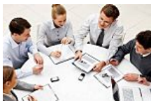
Siete claves para hacer más eficientes las