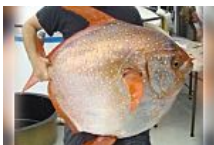
Descubren el primer pez de sangre caliente, el