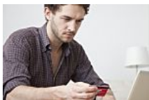
Cómo comprar en China desde Argentina con las (Inversor Global)