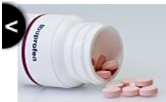
Ibuprofeno o paracetamol, ¿qué es más