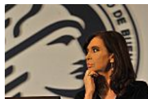
Cristina Fernández asegura que hay