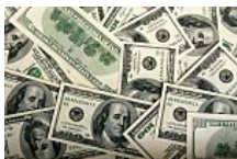
El dólar blue aumenta a 12,67 pesos -